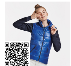
MONTANA WOMAN RA5084