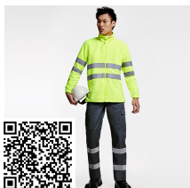
DAILY HV HV9307